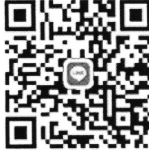
QR Code คณะศิลปศาสตร์