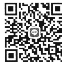
QR Code คณะศึกษาศาสตร์ (สำรอง)