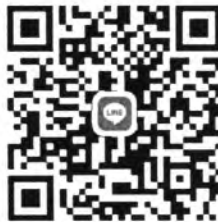
QR Code กลุ่มสั่งซื้อชุดและอุปกรณ์แต่งกายของนักศึกษา

นักศึกษาสามารถสั่งซื้อชุดและอุปกรณ์แต่งกายของนักศึกษา ระหว่างวันที่ ๒๕ - ๒๖ พฤษภาคม ๒๕๖๖ โดยการสแกน QR Code ด้านล่างนี้ เข้าร่วมกลุ่ม Line เพื่อทราบรายละเอียดการสั่งจองและชำระเงิน