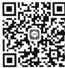
QR Code คณะศิลปศาสตร์