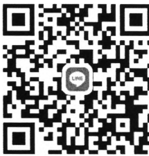
QR Code กลุ่มสั่งซื้อชุดและอุปกรณ์แต่งกายของนักศึกษา

นักศึกษาสามารถสั่งซื้อชุดและอุปกรณ์แต่งกายของนักศึกษา ระหว่างวันที่ ๑ - ๒ พฤษภาคม ๒๕๖๖ โดยการสแกน QR Code ด้านล่างนี้ เข้าร่วมกลุ่ม Line เพื่อทราบรายละเอียดการสั่งซื้อและชำระเงิน