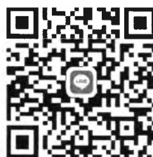
QR Code คณะศิลปศาสตร์