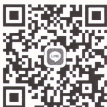
QR Code กลุ่มสั่งซื้อชุดและอุปกรณ์แต่งกายของนักศึกษา

นักศึกษาสามารถสั่งซื้อชุดและอุปกรณ์แต่งกายของนักศึกษา ระหว่างวันที่ ๖ - ๒๘ กุมภาพันธ์ ๒๕๖๖ โดยการสแกน QR Code ด้านล่างนี้ เข้าร่วมกลุ่ม Line เพื่อทราบรายละเอียดการสั่งจองและชำระเงิน